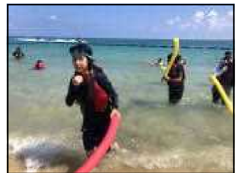
<東村&八幡児童交流の翼受入25回：海洋体験>