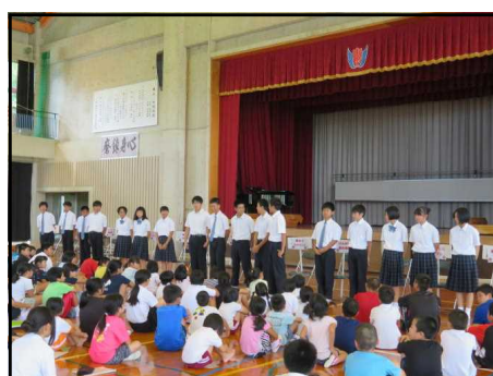
<久志駅伝選手激励>