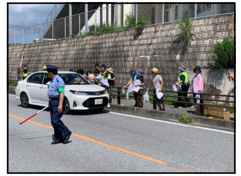
<夏の交通安全パインアップル作戦：7月13日実施>