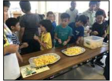
<パイン植え付け・パイン収穫体験・パイン試食会> 7月25日実施>