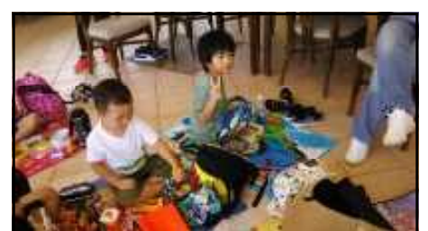
<春の遠足：幼稚園～小学校4年生対象：5月19日実施>