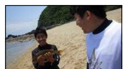
<第23回海の体験学習：小5～中学生対象：5月19日実施>