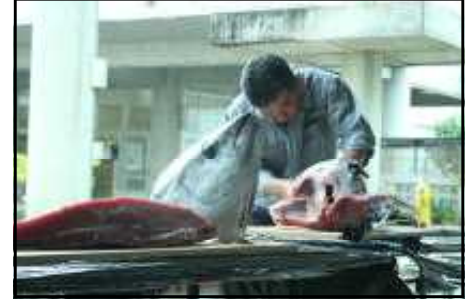
<魚さばき体験：マグロの解体ショー：小5～中学生対象：5月10日実施>