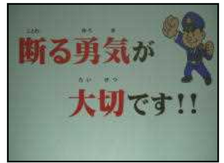
<薬物乱用教室：小学校5・6年生対象：5月15日実施>