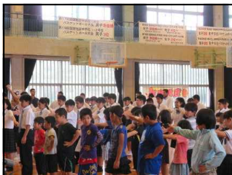
<全校朝会：集合訓練2>