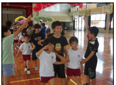
<小1年生を迎える会1>