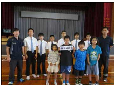
<委員会結成式：美化委員会>