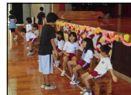
<小1年生を迎える会2>