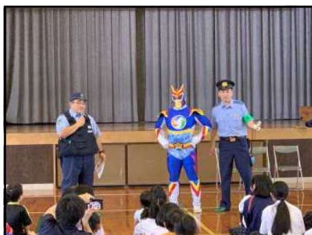
<不審者対策訓練安全講話>