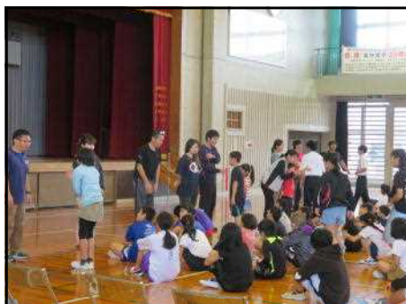
<全校朝会：集合訓練1>