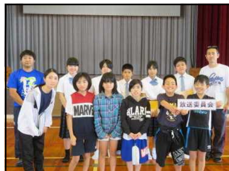
<委員会結成式：放送委員会>