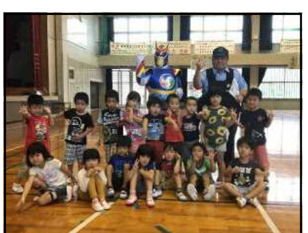
<不審者対策訓練：幼稚園生>