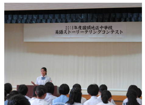
<英語ストーリーコンテスト>