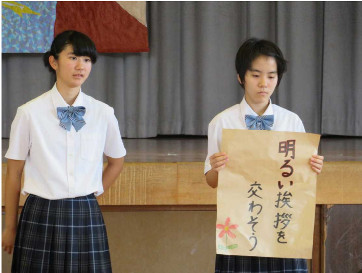
<生徒会執行部：4月の月目標反省>