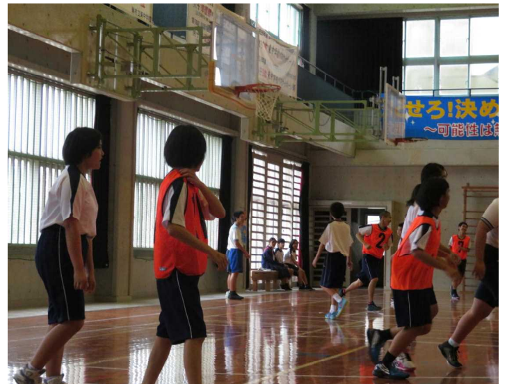
<中学校：新入生歓迎会>