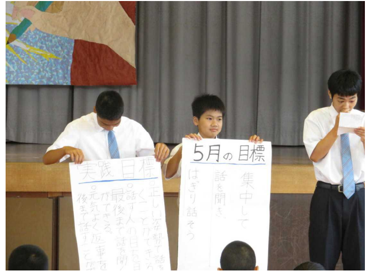
<中学校楽習委員会：5月の月目標発表>