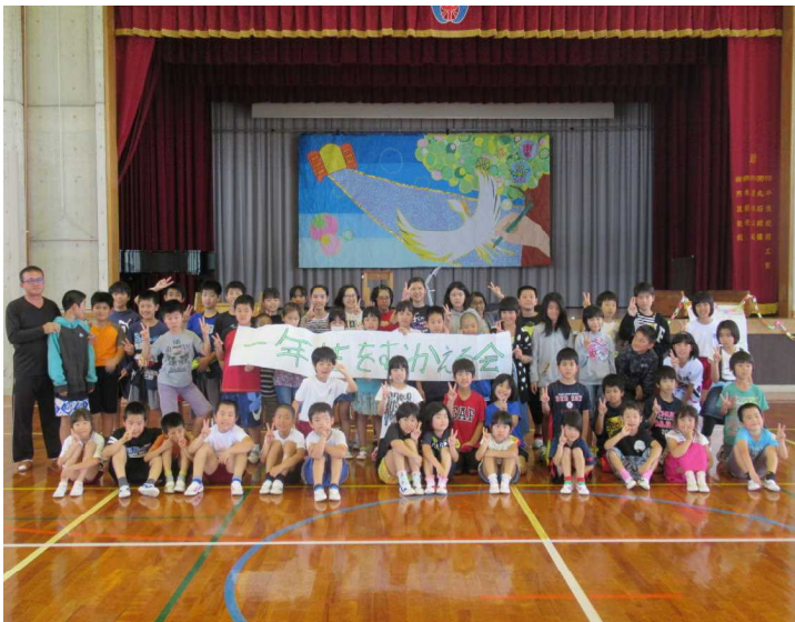
<小学校：1年生を迎える会>