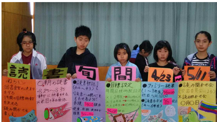
<小学校学習委員会：読書旬間の発表>