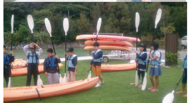
<小学校5年生：宿泊学習>