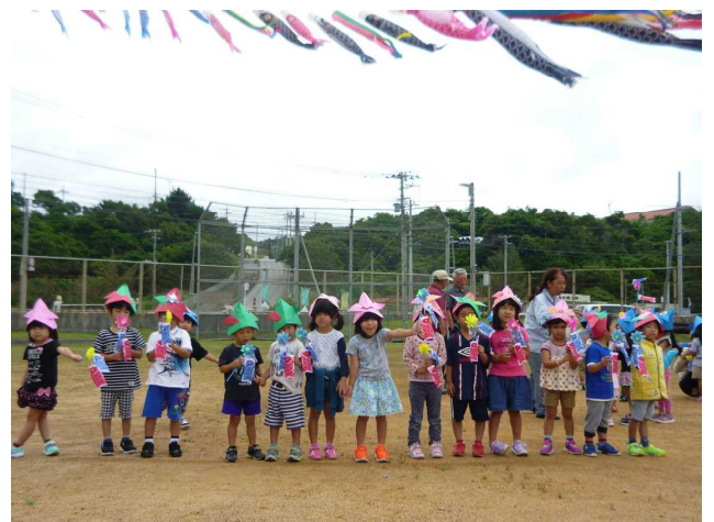
<幼稚園：鯉のぼり掲揚式>