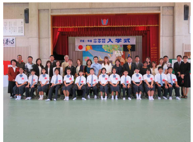
<中学校新入生と担任・保護者>

☆小学校のミニバスケットボールの活動日は、月・火・水・金とします。木曜日と日曜日は活動しない日となります。練習試合は土曜日を実施し、大会等がある場合は、保護者会と相談して日曜日に活動できるようにします。