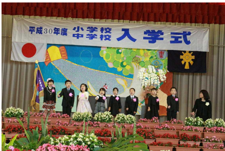
<小学校新入生と担任>